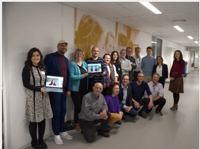
SACRED Kick off meeting Rotterdam, 11-14 Novembre 2024