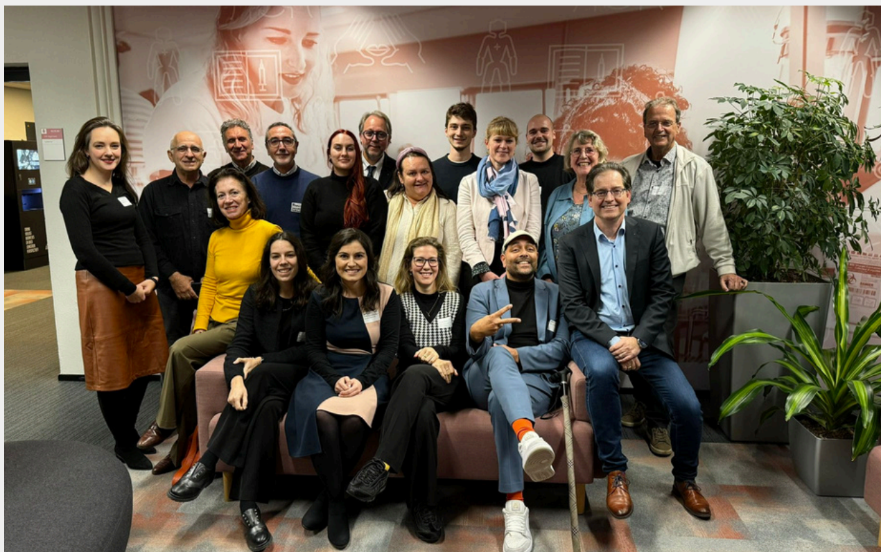
SACRED kick off meeting Rotterdam, 11-14 Novembre 2025

"Per garantire che nessuno venga lasciato indietro, dobbiamo accogliere la popolazione anziana e impegnarci per costruire società inclusive che consentano agli anziani di vivere con dignità, indipendenza e opportunità".