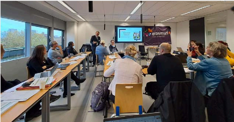
SACRED Kick off meeting Rotterdam, 11-14 Novembre 2024

L'evento di avvio ha posto le basi per gli ambiziosi obiettivi di SACRED, promuovendo la collaborazione, le pratiche basate sull'evidenza e le soluzioni pratiche per migliorare l'assistenza agli anziani in tutta Europa.