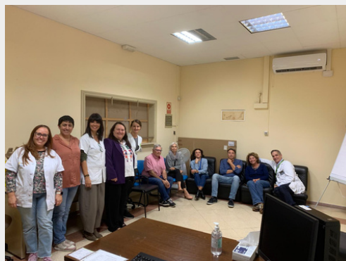
Meeting Tenerife, 10 Dicembre 2024

Bruxelles, 3-4-5 marzo 2025 INVITO - SACRED a HOPE Responding to Heatwaves in Older People Ecosystem" Conferenza finale del progetto finanziato dall'UE Erasmus +, Assemblea generale dell'ENSA European Network of Social Authorities 2025 e riunione dei partner SACRED.